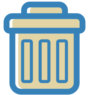
Jetez vos mouchoirs